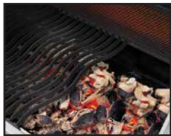
WAVE Grillroste aus Gusseisen Cast Iron WAVE Cooking Grids Gietijzeren WAVE grill-roosters Grilles de cuisson WAVE en fonte