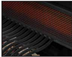
Holzkohle-Heckbrenner für Drehspieß Rear Charcoal Rotisserie Burner Draaispitbrander achterin Brûleur arrière pour rôtissoire à charbon