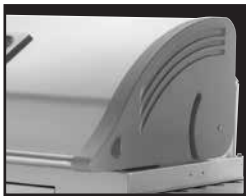
LIFT EASE Rollhaube LIFT EASE Roll Top Lid LIFT EASE roldeksel Couvercle LIFT EASE