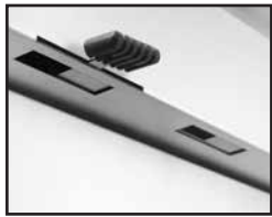
Lüftungsventile Air Vents Luchtsleuven Clapets d'aération