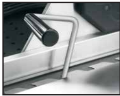
Höhenverstellbare Holzkohlewanne Adjustable Charcoal Bed Verstelbare houtskoolbak Bac à charbon réglable en hauteur